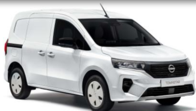
QNG Bílá (bez příplatku)