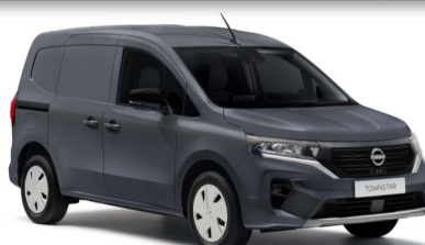
KPW Šedá Urban (5 785 Kč*)