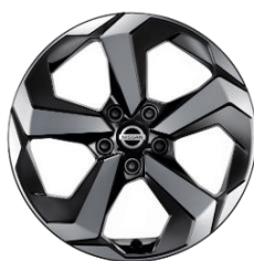
18" kola z lehké slitiny