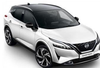
Bílá Pearl - Černá (XDF)