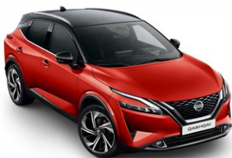
Červená Sunset - Černá (XEY)

DVOUBAREVNÝ LAK – 11 900 Kč (příplatek k ceně barvy karoserie)