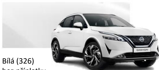
Bílá (326) bez příplatku