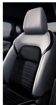
Černé látkové čalounění se světle šedými vložkami ze syntetické kůže (K)