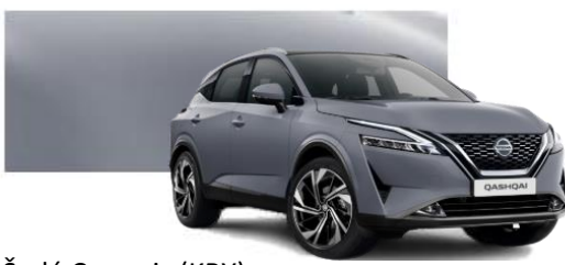
Šedá Ceramic (KBY)