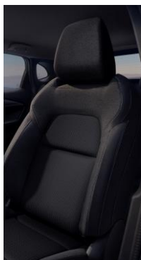
Černé látkové čalounění (G)