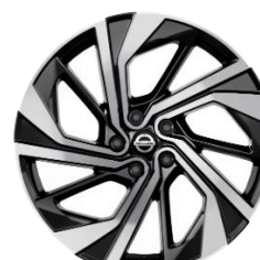
20" kola z lehké slitiny