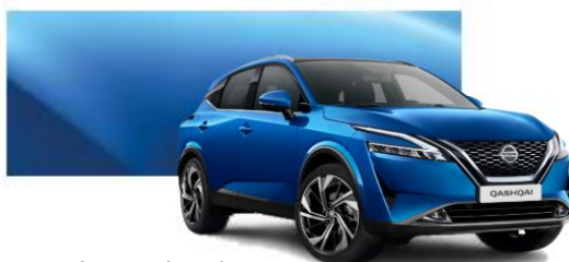
Modrá Vivid (RCF)