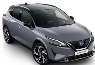
Šedá Ceramic - Černá (XFU)