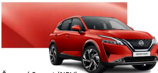
Červená Sunset (NBV)