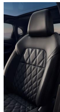
Čalounění sedadel kůže Nappa 5 (B)