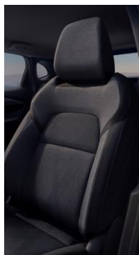
Černé látkové čalounění s šedými vložkami (G)