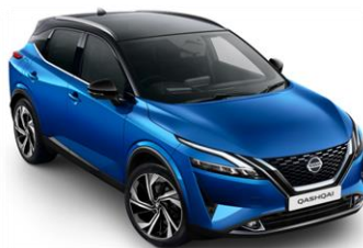
Modrá Vivid – Černá (XFV)