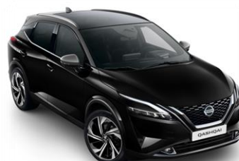
Černá - Šedá (XDK)