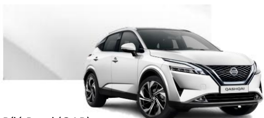
Bílá Pearl (QAB)