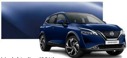
Modrá Indigo (RBN)