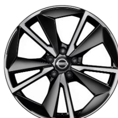
19" kola z lehké slitiny