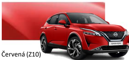
Červená (Z10) 8.900 Kč