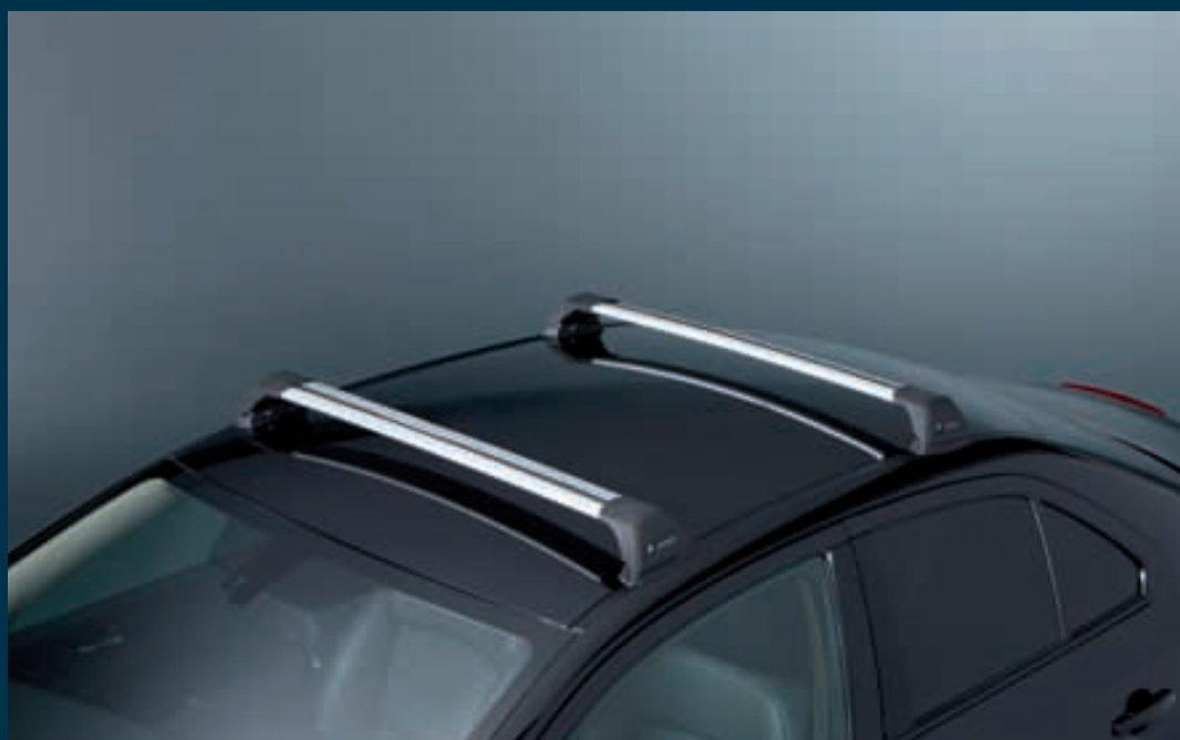
3 | Základní střešní nosič 1 Oválné hliníkové trubky, s uchycením do T-drážky Obj. čís. 990E0-57L33-000