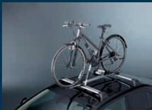
1 | Střešní nosič jízdních kol 1 pro transport kompletního jízdního kola. Obj. čís. 990E0-59J20-000