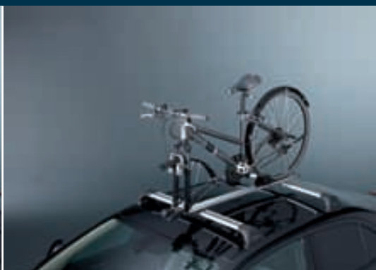
2 | Střešní nosič jízdních kol 1 pro transport jízdního kola s demontovaným předním kolem. Obj. čís. 990E0-59J21-000